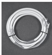
③暖房機と制御盤 接続用ケーブル